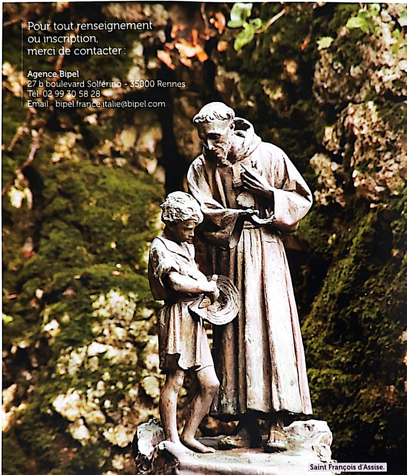
Saint François d'Assise.

Agence Bipel 27 b boulevard Solférino - 35000 Rennes Tél. 02 99 30 58 28 Email : bipel.france.italie@bipel.com