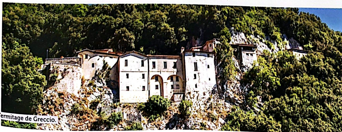
Ermitage de Greccio.

Les messes et les rencontres sont sous réserve de disponibilité des lieux et des intervenants. De même, l'ordre des visites peut être soumis à modifications. Cependant, l'ensemble des visites mentionnées au programme sera respecté.